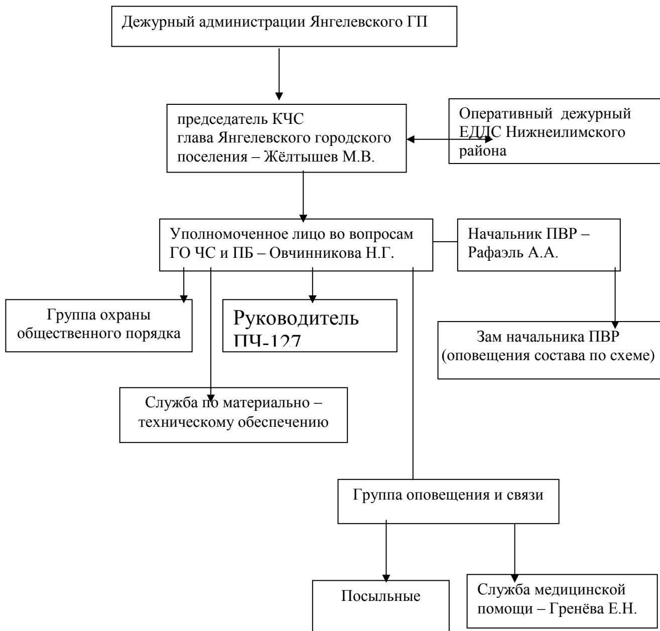
Схема оповещения Янгелевского городского поселения